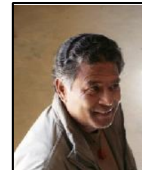
Raja (externe contacten)