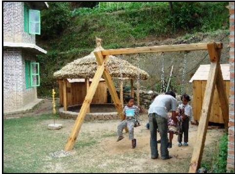
Overzicht schommel, zandbak, speelhuisjes