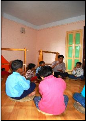
Meester Rajib met klas