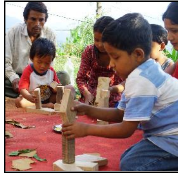
Met de blokken spelen